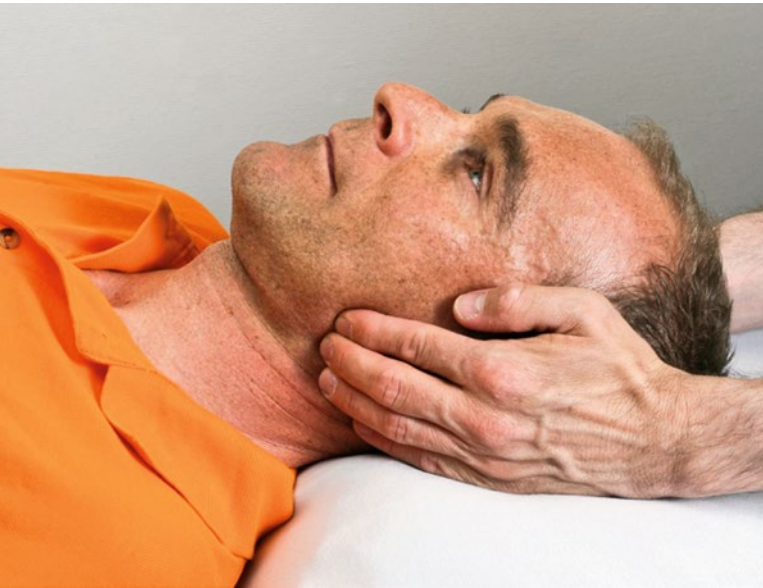
Foto 2: Extraorale Triggerpunktbehandlung des M. masseter. | Photo 2: Traitement extra-oral des trigger points du muscle masséter.

Es bewährt sich, mit dem Ganzkörperstatus und einer Inspektion des Patienten zu beginnen. Dabei soll auch auf Gesichtasymmetrien und Hypertrophien der Muskeln Masseter und Temporalis geschaut werden. Bei der enoralen 2 Inspektion muss auf Okklusionsstörungen 3 , Zahnabrasionen und Zungen- und Wangenimpressionen geachtet werden. Diese Beobachtungen sind Hinweise für Bruxismus und Pressen der Zähne tagsüber [1, 2, 3, 4].